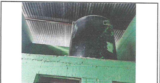
Foto 6: Se necesita un rotoplast de mayor capacidad debido a la cantidad de estudiantes y al escaso servicio de agua potable.

Observación: Si es necesario se pueden agregar hojas adicionales y actualizar el número de hojas.