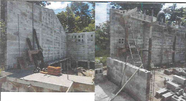
Foto 9: Paredes y techo de la cocina se están reconstruyendo para que las cocineras trabajen en un ambiente agradable.