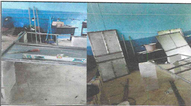
Foto 3: Las puertas de los baños y salones de clase están muy deterioradas, necesitan ser cambiadas.