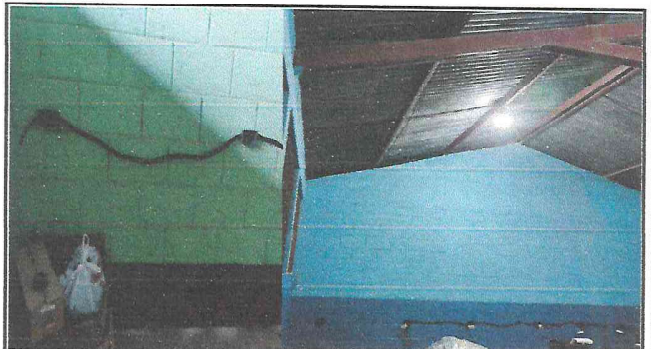
Foto 4: En todas las áreas del centro educativo se está mejorando el sistema eléctrico.