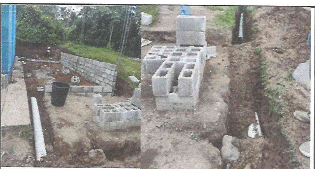
Foto 5: Se están mejorando drenajes e instalaciones pluviales para que se distribuya correctamente el agua.