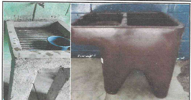
Foto 2: Se está colocando una pila adecuada para lavar trastos, trapeadores y sirva a la vez de lavamanos.