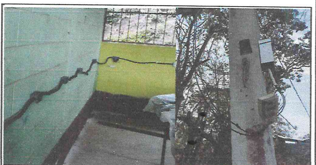
Foto 12: La mayoría de elementos del sistema eléctrico se están renovando (cableado, tomacorrientes, contador)

Observación: Si es necesario se pueden agregar hojas adicionales y actualizar el número de hojas.