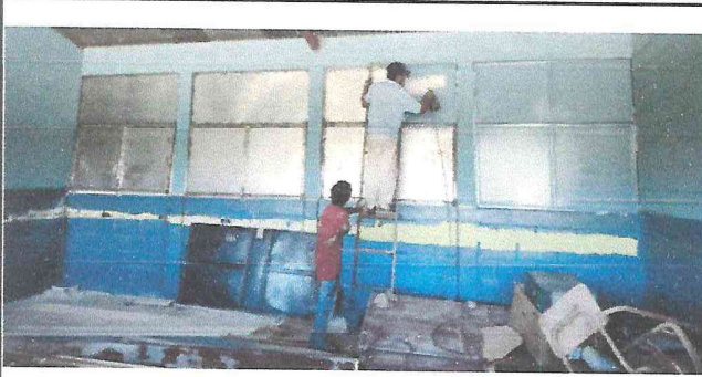
Foto1: Se está sellando un salón que servirá como área de computación y bodega.