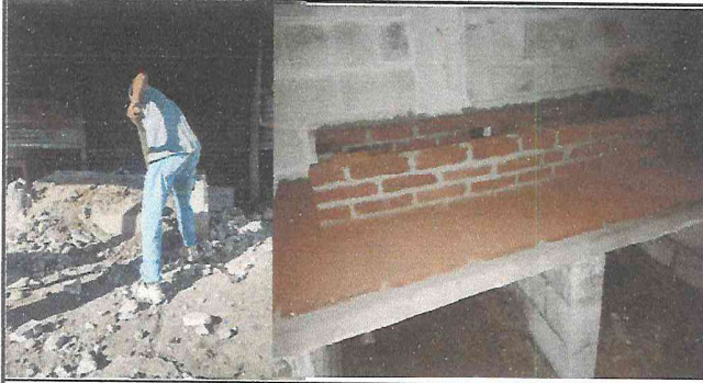
Foto 7: Se está reubicando la estufa rural y reconstruyendo totalmente para que esté al servicio de las cocineras del Centro Educativo.