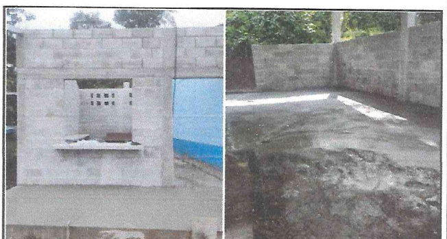
Foto 10: La torta de concreto estaba en malas condiciones y se está renovando y expandiendo.