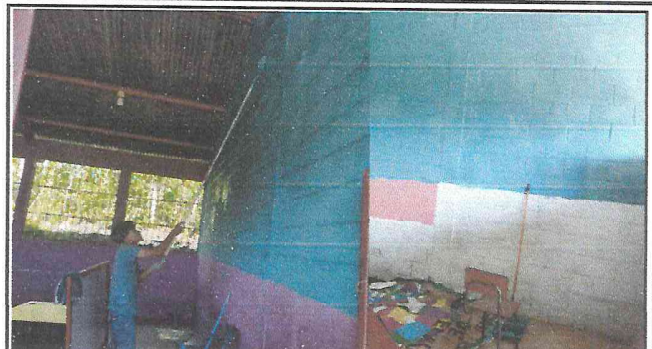
Foto 8: Todas las paredes del Centro Educativo se están renovando con pintura azul de aceite y jade de agua.